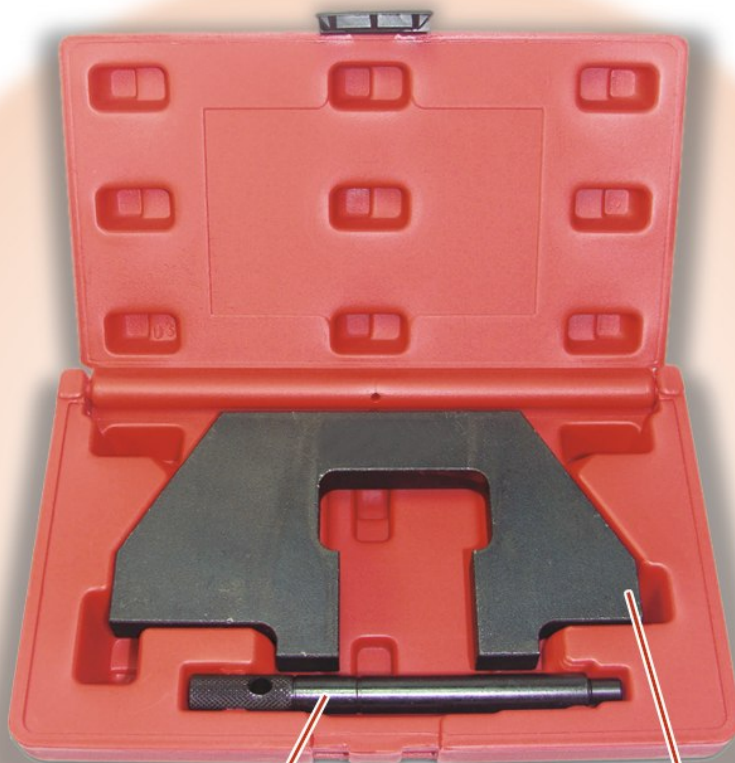
Schwungrad-Fixierdorn, BMW 11 2 300

Achtung: für M70 und M73 Motoren werden zwei Stück benötigt!