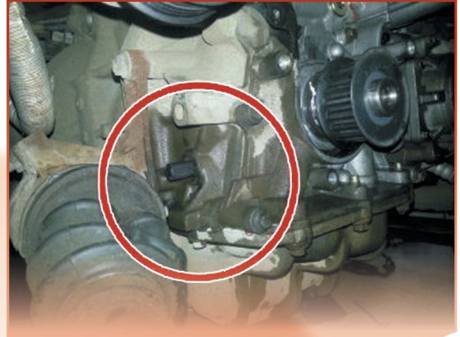
Der Fixierstift mit der OE 303-1054 ist bei der neuen Spannrolle dabei.

Kurbelwellen-Riemenscheiben-Abzieher und Montagesatz (universal) ersetzt auch: OE 303-511, 21-215, 13-019,211-014,303-510,21-214